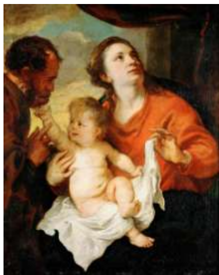
1. Антонис Ван Дейк «Святое семейство»;