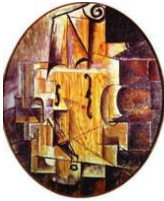
2. Пабло Пикассо «Скрипка»;