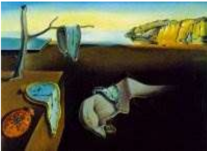
4. Сальвадор Дали «Постоянство памяти».